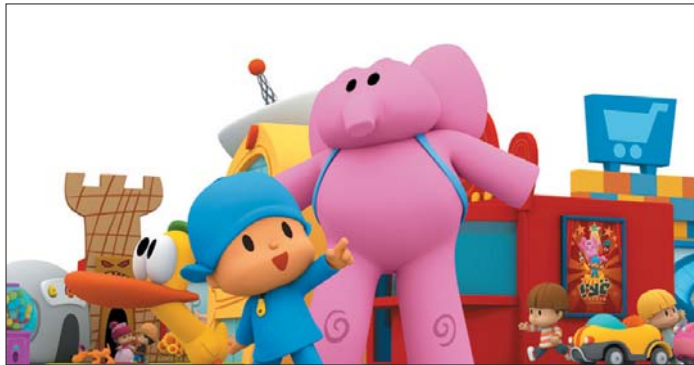
Mundo Pocoyó nace para convertirse en un espacio lúdico y educativo de referencia.